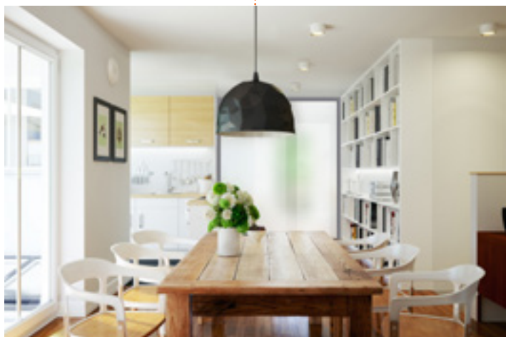
OFF Zamontowanie w otworze ściennym da efekt niezwykłego wewnętrznego okna, na przykład pomiędzy kuchnią, a salonem, którego przezierność zmieniasz wygodnie za pomocą pilota.