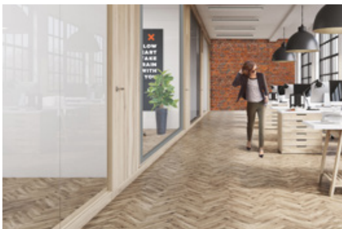
ON Niecodzienna szklana ścianka działowa

ZOBACZ JAKIE MOŻLIWOŚCI DAJE SYSTEM "PLUG AND PLAY"