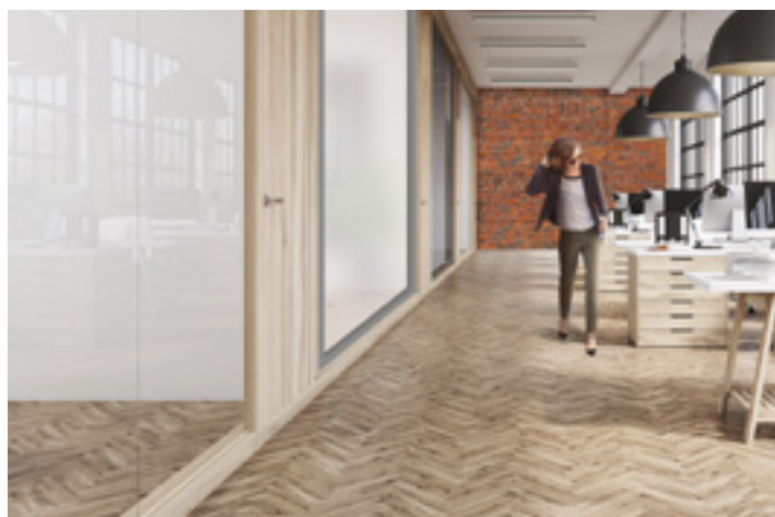
OFF Niecodzienna szklana ścianka działowa, która zapewni dostęp światła dziennego, lub zagwarantuje prywatność i stanie się nieprzezierna.